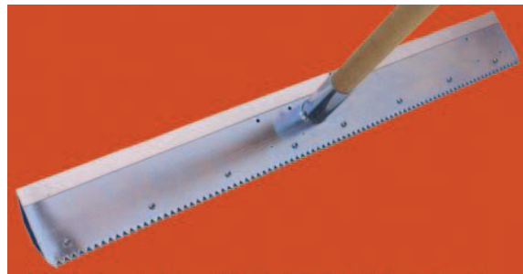
Raschiatore in alluminio

Diametro 7 cm - Completo di valvola di chiusura e porta gomma di diametro 22/25 mm