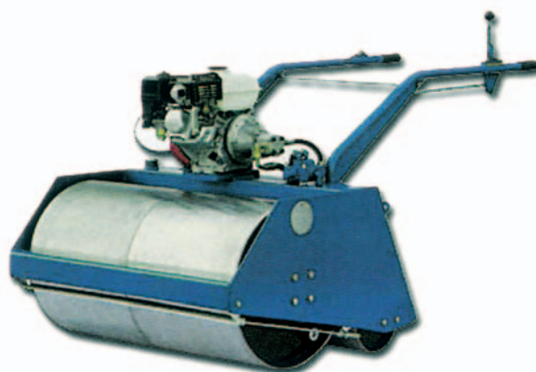
Rullo a motore

Tamburo: Lunghezza 70 cm - Altezza 50 cm Diametro 50 cm - Spessore 6 mm Peso massimo con riempimento ad acqua: 180 kg