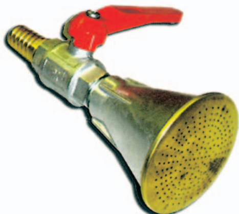
Soffione in alluminio

Diametro 7 cm - Completo di valvola di chiusura e porta gomma di diametro 22/25 mm