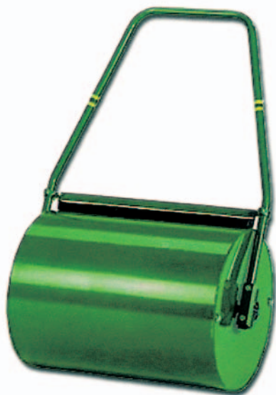
Rullo in ferro manuale con spazzola

Molto resistente in quanto bordato e borchiato Densità: 90% - Mt. 18 x 2